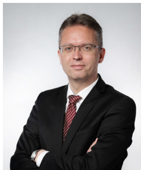
Dr. Hankó Balázs kultúráért és innovációért felelős miniszter

Az egyetemi modellváltásnak köszönhetően olyan kiszámítható és átlátható finanszírozási háttér jött létre, amely egyszerre biztosít rugalmasságot az intézmények számára, hogy gyorsan reagáljanak a változó társadalmi és gazdasági igényekre, de az egyetemi modellváltás az intézményi autonómiát is garantálja. A felsőoktatás megújulásának eredményét egyértelműen jelzi, hogy már második éve több mint százezren nyertek felvételt a hazai felsőoktatásba és immáron 12 magyar egyetem van a világ legjobb 5 százalékában. Elismertségüknek köszönhetően a világ minden tájáról érkeznek hallgatók. Azok a fiatalok tehát, akik Magyarországon tanulnak tovább, egy olyan össznemzeti és nemzetközi környezet részesei lehetnek, amelyben egyszerre van lehetőség a tudás, a tapasztalat és a kulturális értékek cseréjére. Emellett a Kormány arra is lehetőséget biztosít, hogy a magyar diákok külföldön is tapasztalatot szerezzenek. Ennek érdekében számos ösztöndíj és nemzetközi mobilitási lehetőség elérhető mindazoknak, akik külföldön is szereznének egy kis tapasztalatot, hogy aztán itthon kamatoztassák azt. Az egyetemi polgárok közössége olyan kapcsolatok kialakítását teszi lehetővé, amelyek hozzájárulnak a sikerhez, veletek együtt pedig hazánk és az egész magyar nemzet sikeréhez. A következő lépés már rajtatok áll, de soha ne féljeteek nagyot álmodni! Olyan helyet válasszatok, ahol nemcsak tanulni, fejlődni is tudtok.